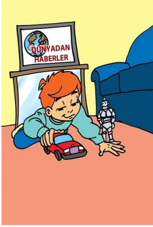
Şekil 3. "Dünyadan haberi olmamak" deyiminin görseli

Berkay, bütün gece mutlu ve neşeli bir çocuk olarak oradan oraya zıpladı durdu. Yatağına uzandığında içinden “Hayat ne güzel!” diye geçirdi. O, dünyayı toz pembe görüyordu . Kocaman bir gülümseme ile uykuya daldı.