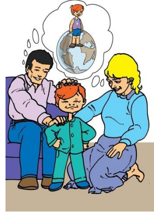
Şekil 5. "Dünya dünya olalı" deyiminin görseli