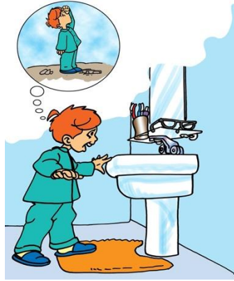
Şekil 4. "Gökte ararken yerde bulmak" deyiminin görseli