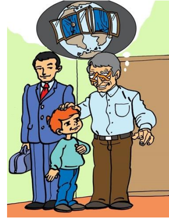
Şekil 1. "Dünya penceresi" deyiminin görseli