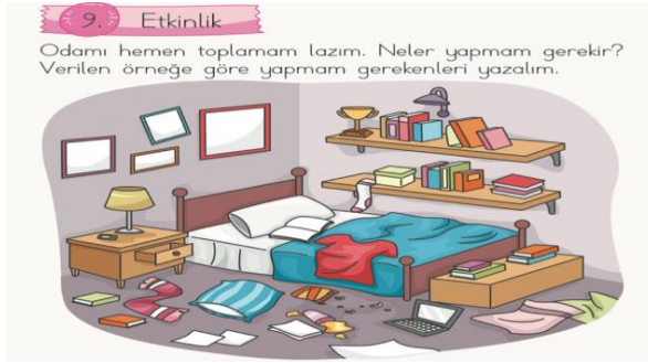
Şekil 2. Anlama Alanına Ait Etkinlik Örneği (İlkokul Türkçe 1 Ders Kitabı)

İlkokul 1 Türkçe Ders Kitabında, dinleme alanı ve görsel okuryazarlık beceriyle ilişkili etkinlikler incelendiğinde, "Görselden/görsellerle hareketle dinleyeceği/izleyeceği metin hakkında tahminlerde bulunur." kazanımıyla ilgili etkinliklere yer aldığı görülmektedir. Etkinliklerin hepsinde öğrencilere ilk olarak bir görsel sunulmuş ardından ise dinleyeceği metinle ilgili tahminler yapması istenmiştir. İşitme engelli öğrenciler için hazırlanan Türkçe 1 yardımcı ders kitabında ise dinleme alanına ait bir etkinlik bulunmadığı saptanmıştır.