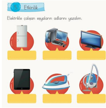
Şekil 4. Okuma Alanına Ait Etkinlik Örneği. (İlkokul Türkçe 1 Ders Kitabı)