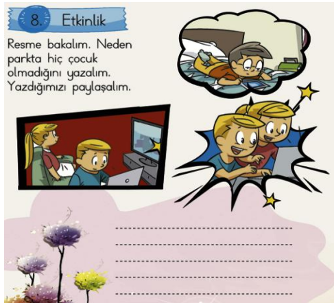
Şekil 6. Yazma Alanına Ait Etkinlik Örneği. (İlkokul Türkçe 1 Ders Kitabı)

İşitme engelli öğrenciler için hazırlanmış yardımcı Türkçe ders kitabında yer alan okuma boyutuna ilişkin etkinliklere bakıldığında ise; görsellerden hareketle kelime gruplama çalışmalarına, görsel destekli kelime bulmacalarına, görsel destekli dil bilgisi etkinliklerine, görsellere dayalı boşluk doldurma çalışmalarına, görselleri verilen kelimelerin eksik seslerini tamamlama çalışmalarına yer verildiği görülmüştür. İşitme engelli öğrenciler için hazırlanmış yardımcı Türkçe ders kitabında, ilkökul Türkçe 1 kitabının aksine görsellerden faydalanarak serbest okuma etkinliklerine yer verilmemiştir. Bunun yerine şekillere denk gelen harflerle kelime oluşturma çalışmaları yapılmış ve görsel algı desteklenmiştir. Bu kitapta farklı yazı karakterleriyle yazılmış okuma metinlerine ise yer verilmemiştir.