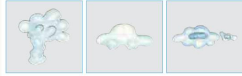
Şekil 3. Anlama Alanına Ait Etkinlik Örneği (Yardımcı Ders Kitabı)

5. Etkinlik: Aşağıdaki bulutlar neye benziyor? Noktalı yerlere yazınız.