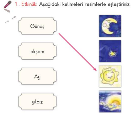
Şekil 5. Anlama Alanına Ait Etkinlik Örneği (Yardımcı Kitap)

Okuma boyutuna ilişkin görsel okuryazarlıkla ilgili ilkökul Türkçe 1 ders kitabındaki etkinliklere bakıldığında, görsellerden faydalanarak okuma çalışmaları ve görsellerden hareketle kelimelerin anlamını bulma çalışmalarının yer aldığı görülmektedir. Aynı zamanda ilgili ders kitabının programda okuma boyutunda yer alan "Farklı yazı karakterleriyle yazılmış yazıları okur." kazanımıyla ilişkili okuma metinlerine sıkça yer verdiği tespit edilmiştir.